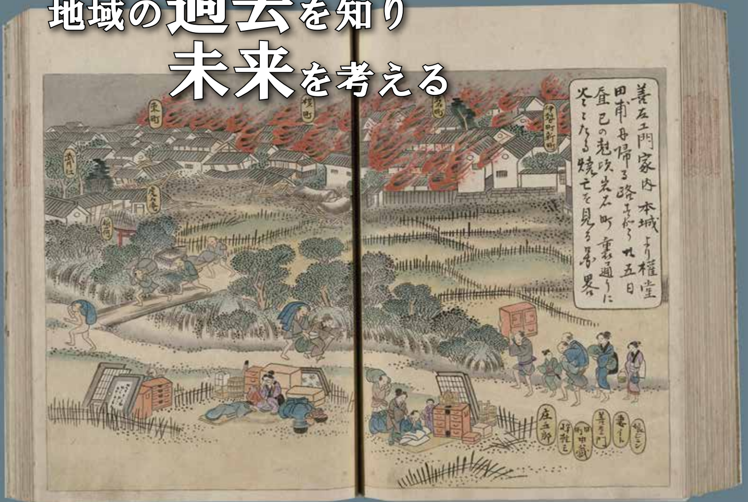
地震後世俗語之種 (信濃教育博物館蔵)