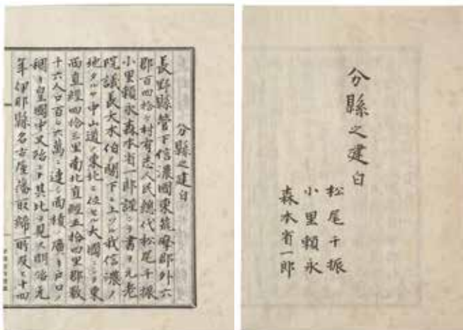
分県之建白