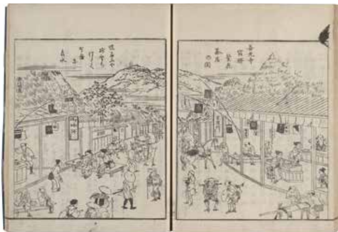
善光寺道名所図会 (県立長野図書館蔵)