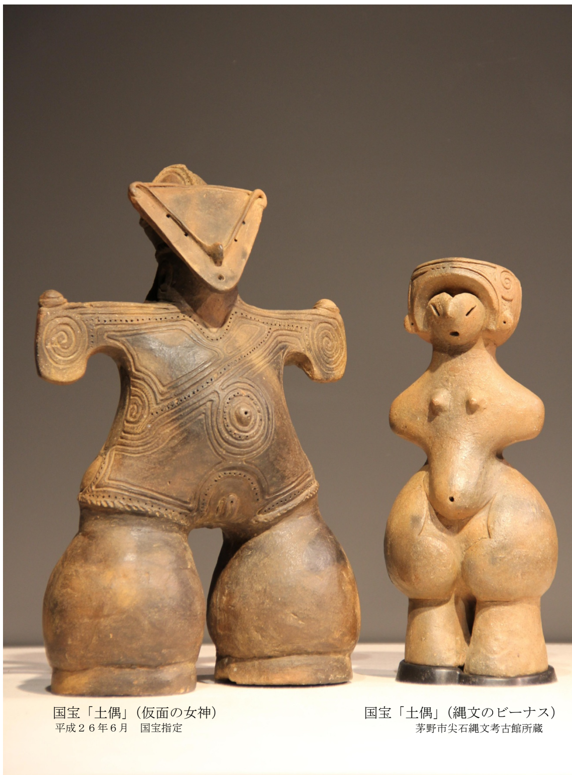
国宝「土偶」(仮面の女神) 平成26年6月 国宝指定